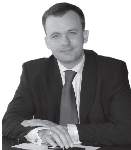
Krzysztof Chojniak Prezydent Piotrkowa Trybunalskiego