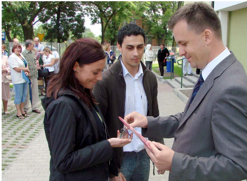
Prezydent Krzysztof Chojniak wręcza klucze lokatorom bloku przy ul. Gospodarczej.

kach na osiedlu Żwirki łącznie powstało 75 nowych mieszkań.