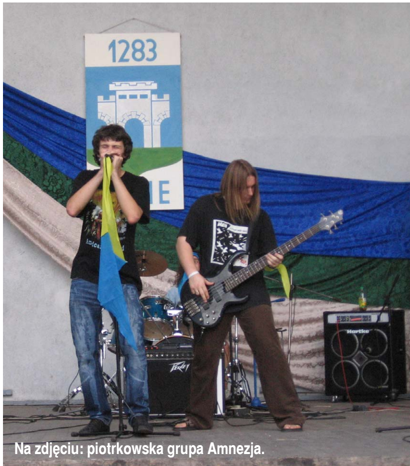
Na zdjęciu: piotrkowska grupa Amnezja.

Kolejną okazją do zacieśnienia współpracy obu miast było Partnerskie Muzykowanie w Piotrkowie Trybunalskim i wrześnieowy wyjazd do Równego Piotrkowskiej Orkiestry Kameralnej. Zaproszenie do wspólnych koncertów Orkiestra otrzymała od władz miasta Równie oraz od dyrekcji tamtejszej Szkoły Muzycznej. Program koncertów obejmował utwory G.F.Händla, W.A.Mozarta, C. Saint-Saëns, M.Skorina, W.Kilara. Wspólne muzykowanie pedagogów i uczniów szkół muzycznych z miast partnerskich ma już wieloletnią tradycję.