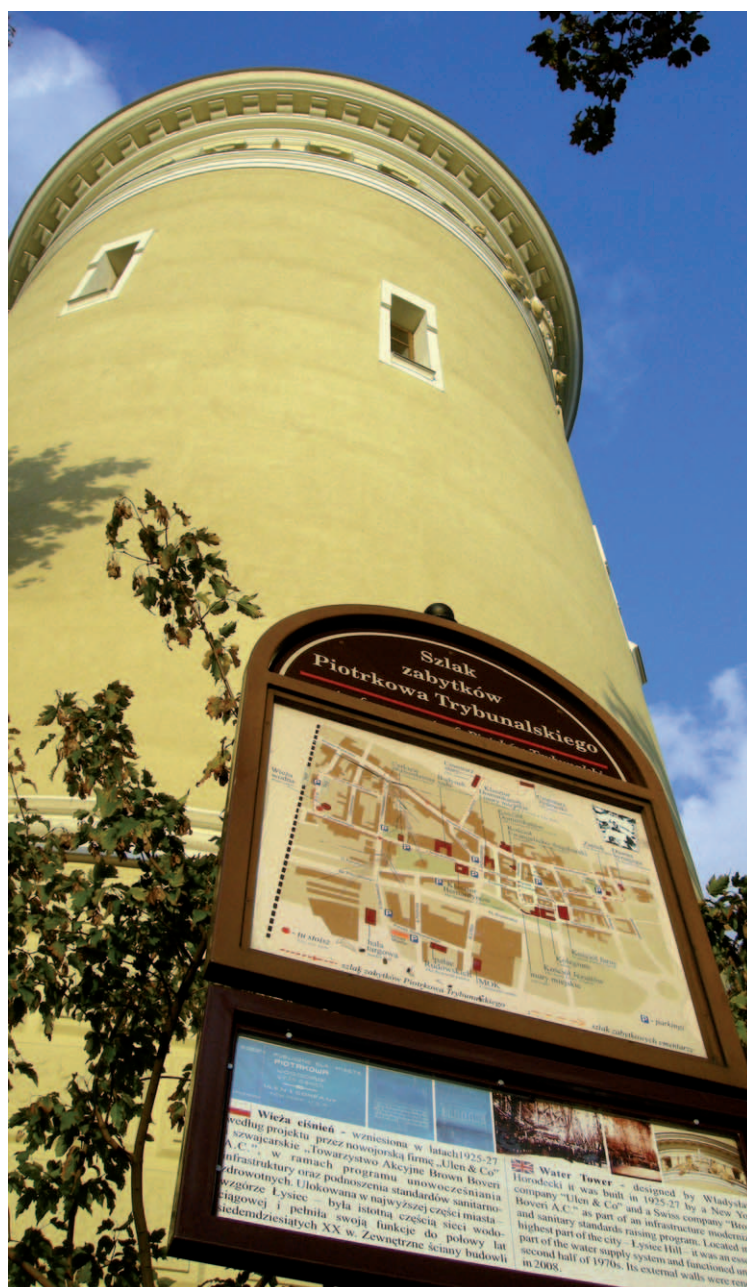
Wieża ciśnieniowa była pierwszym budynkiem wyremontowanym z pieniędzy „Traktu”.

Władze miasta postanowiły wykorzystać tę historyczną wielokulturowość trybunalskiego grodu. Tak zrodził się projekt „Trakt Wielu Kultur”, który zakłada odnowienie najstarszej części miasta. Rewitalizacja rozpoczęła się w ubiegłym roku i prowadzona jest na wszelkie dostępne sposoby – poczynając od pozyskiwania pieniędzy, poprzez remont historycznej części Piotrkowa, przez programy, usprawnienia, akcje społeczne i kulturalne, aż do szerokiej promocji – zarówno w mieście, jak i w kraju. O tym, że pomysł takiej rewitalizacji jest trafiony, świadczą fakty - miasto dostało z pieniędzy unijnych ponad 16 mln zł! Nasz „Trakt” został też doceniony przez fachowców. Łódzki oddział Towarzystwa Urbanistów Polskich, który organizuje doroczny konkurs na najlepiej zagospodarowaną przestrzeń publiczną w województwie, wyróżnił Trakt Wielu Kultur w kategorii „Zrewitalizowana przestrzeń publiczna”.