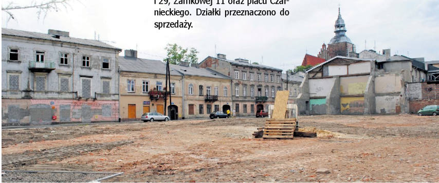
Przygotowany pod zabudowę mieszkaniową i handlowo-usługową teren czeka na inwestorów

Działania samorządu dostrzegają także prywatni inwestorzy, którzy stawiają nowe budynki mieszkalne oraz handlowo-usługowe. Takie inwestycje prowadzone są przy ulicy Wojska Polskiego/Wiejskiej oraz Wojska Polskiego 1a.