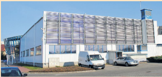
■ Solary na basenie przy ul. Belzackiej chronią środowisko i oszczędzają wydatki na ogrzewanie pływalni

pozyskało 256 856 zł dotacji z Wojewódzkiego Funduszu Ochrony Środowiska i Gospodarki Wodnej w Łodzi. W 2011 roku jako pierwsze w kolektory słoneczne wyposażone zostały: kryta pływalnia przy ulicy Próchnika oraz budynek Domu Dziecka przy ul. Wysokiej. ■