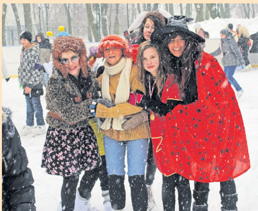
■ Piotrkowianie chętnie uczestniczą w imprezach na lodowisku

■ Już od pięciu lat piotrkowskie lodowisko cieszy się dużą popularnością. To trafiona inwestycja – podkreślają zgodnie łyżwiarze.