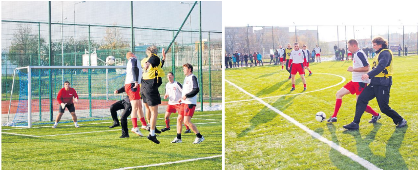
W meczu inauguracyjnym działalność „orlika” przedstawiciele samorządu zagrali z pedagogami SP nr 12

To już ostatnie boisko, jakie powstało w ramach rządowego programu „Moje boisko – Orlik 2012”. Wcześniej orliki powstały przy Zespole Szkolno-Gimnazjalnym Nr 1 (ul. Wysoka) oraz przy Gimnazjum Nr 2 (ul. Broniewskiego). ■