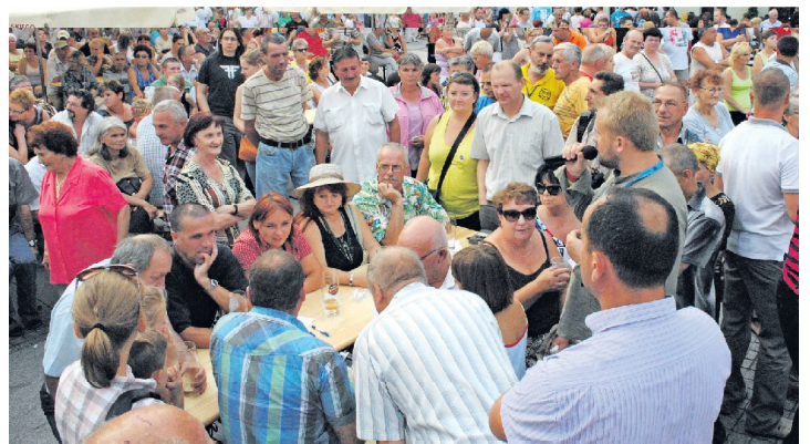
Biesiada Trybunalska przyciągnęła na rynek tłumy piotrkowian