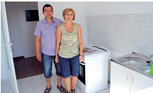
■ Lokatorzy otrzymali klucze do nowych mieszkań we wrześniu

■ Czterdzieści osiem rodzin odebrało klucze do nowych mieszkań w bloku piotrkowskiego Towarzystwa Budownictwa Społecznego, który stanął przy ulicy Modrzewskiego