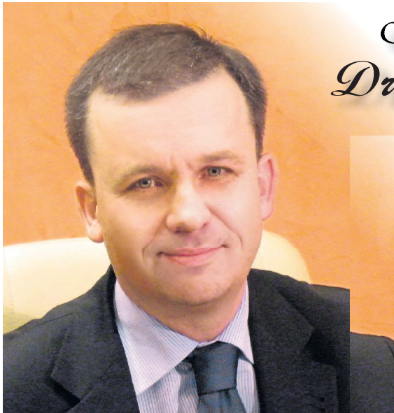
Prezydent Piotrkowa Trybunalskiego Krzysztof Chojniak