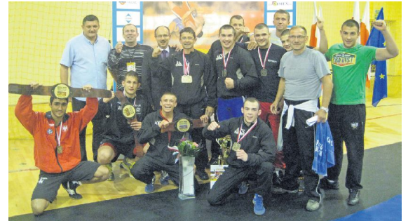
Zapaśnicy MKS z medalami Mistrzostw Polski

■ Osiem medali Mistrzostw Polski dla zapaśników Atletycznego Klubu Sportowego oraz awans szczypiornistów MKS Piotrkowianin do PGNiG Superligi to największe tegoroczne sukcesy piotrkowskich sportowców.