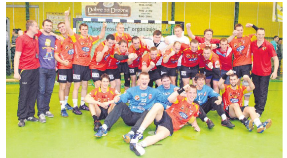
Drużyna MKS Piotrkowianin świętuje powrót do Superligi