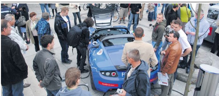
Rajd Tallin - Monte Carlo - zainteresował nie tylko kierowców