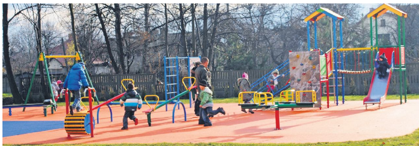
■ Plac zabaw przy Szkole Podstawowej Nr 5

■ Termomodernizacja budynku Gimnazjum Nr 2 oraz budowa dwóch kolejnych placów zabaw w ramach programu „Radosna Szkoła”, to największe tegoroczne inwestycje w piotrkowskie szkoły.