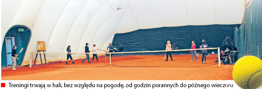
Treningi trwają w hali, bez względu na pogodę, od godzin porannych do późnego wieczoru