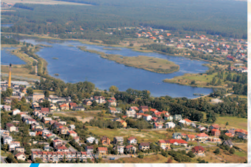
Rozwój turystyki do 2014 roku