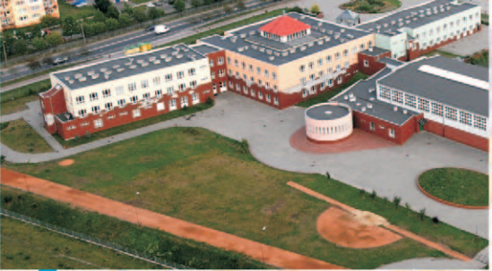
Inwestycje w edukację do 2014 roku