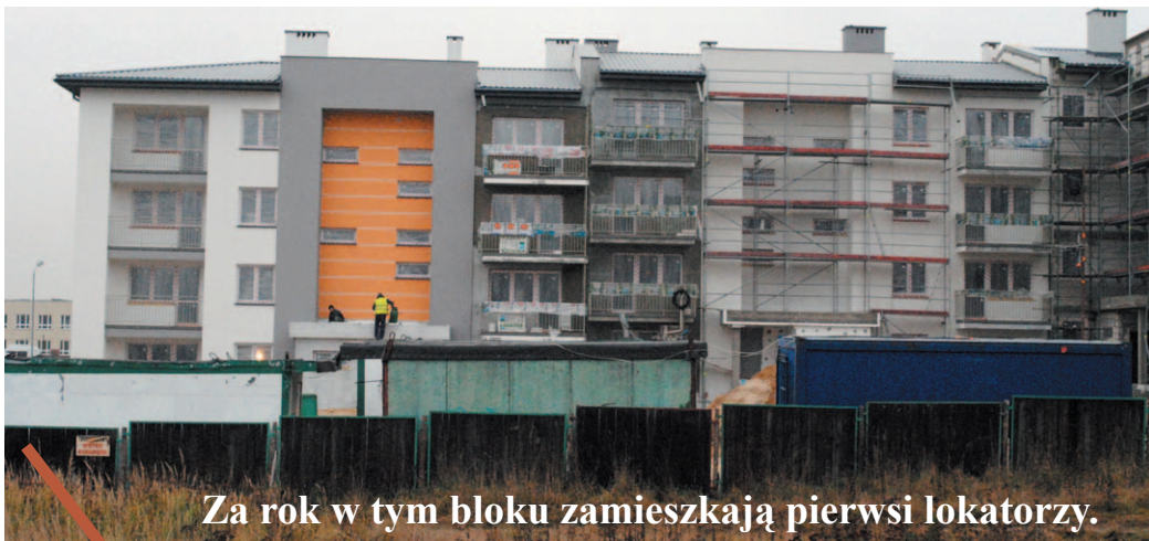
Za rok w tym bloku zamieszkają pierwsi lokatorzy.