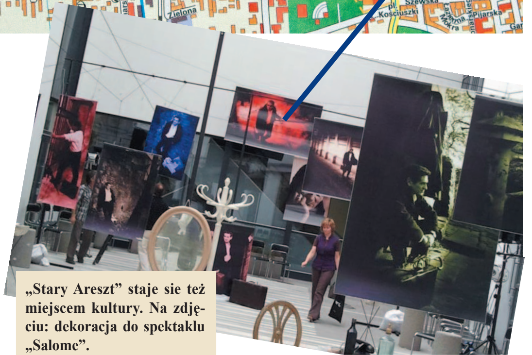
„Stary Areszt” staje się też miejscem kultury. Na zdjęciu: dekoracja do spektaklu „Salome”.