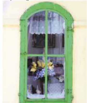
19. ul. Belzacka 183. (róg ul. Dworskiej)

19 ul. Belzacka 183. (róg ul. Dworskiej) - zabudowana kapliczka kwadratowa wysokości ok. 2 m., kryta dachówką zacementowaną z metalowym krzyżem. We wnętrzu pięć obrazów Matki Bożej w typie częstochowskim, obraz Serca Jezusa i figurka Matki Bożej Niepokalanie Poczętej. Obecna wybudowana na fundamentach starszej w 1912 roku przez ówczesnego właściciela folwarku Belzacka Karola Czajkowskiego.