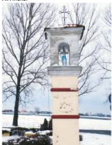
18. ul. Kasztelańska 1. (róg ul. Łódzkiej)

17 ul. Gała 2. (róg ul. Łódzkiej) - kapliczka słupowa, o wysokości ok. 4 m., z kwadratowym cokolem. We wnętrzu od strony południowej w I kondygnacji obraz Matki Boskiej Częstochowskiej i popiersie Jana Pawła II; w II kondygnacji figura Matki Boskiej Niepokalanie Poczętej. Ostatnia, IIII kondygnacja zamurowana, z zaznaczonymi farbą blendami. Daszek z dachówki z metalowym krzyżkiem. Postawiona przez właścicieli młyna w Daszówce w początkach XIX wieku.