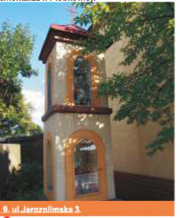
9. ul. Jerozolimska 3.