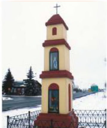
17. ul. Gała 2. (róg ul. Łódzkiej)

17 ul. Gała 2. (róg ul. Łódzkiej) - kapliczka słupowa, o wysokości ok. 4 m., z kwadratowym cokolem. We wnętrzu od strony południowej w I kondygnacji obraz Matki Boskiej Częstochowskiej i popiersie Jana Pawła II; w II kondygnacji figura Matki Boskiej Niepokalanie Poczętej. Ostatnia, IIII kondygnacja zamurowana, z zaznaczonymi farbą blendami. Daszek z dachówki z metalowym krzyżkiem. Postawiona przez właścicieli młyna w Daszówce w początkach XIX wieku.