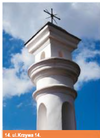
14. ul. Krzywa 14.

Kapliczka – niewielka budowla kultowa, wznoszona przy drogach lub rozdrożach w celach wotywnych, dziękczynnych, obrzędowych itp. W najprostszej postaci drewniana skrzynka z obrazem lub rzeźbą – świętkiem Jezusa, Matki Bożej lub świętego, zawieszona na drzewie lub słupie. W postaci rozbudowanej niewielka forma architektoniczna drewniana lub murowana. (Wikipedia)