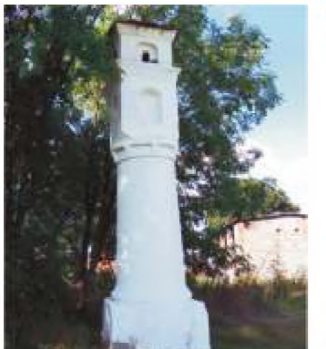
7. ul. Zalesicka 35. (róg ul. Grabskiej)

7 ul. Zalesicka 35. (róg ul. Grabskiej) – kapliczka słupowa o wysokości ok. 6 m. z podstawą i okrągłym korpusem, ozdobionym kwadratowym gzymsem. Na kolumnie umieszczona jest kwadratowa nadbudowa wysokości 1 m. z blendami, ozdobnym okapem i daszkiem z dachówki zwieńczonym krzyżem. Według przekazów kapliczka ta od XIII do XIX wieku, stojąc przy jednym z głównych traktów królewskich, który łączył Piotrków z Krakowem, oznaczała granicę pomiędzy posiadłościami Starostów Piotrkowskich i zakonu OO Norbertanów z Witowa, wielokrotnie przebudowywana (ostatnio w latach 80-tych XIX w.) od początku XIX wieku traktowana jako „choleryczna” to jest chroniąca miasto przed zarazą.