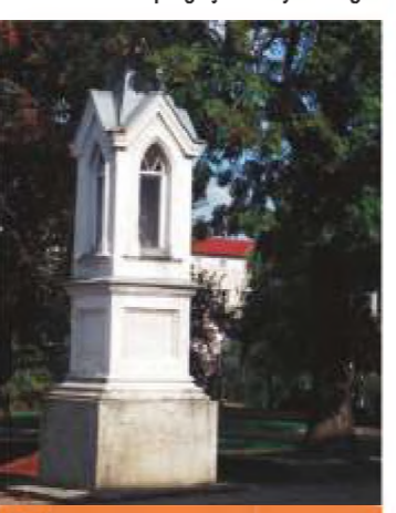
12 ul. Wojska Polskiego 41/43.

11 ul. Wolborska (w lesie wolborskim) - kapliczka Św. Jana dwukondygnacyjna, murowana w kształcie półwalca z kopułą zwieńczoną krzyżem, z metalowym ogrodzeniem. Wewnątrz obraz Matki Boskiej Częstochowskiej i piterek z wizerunkiem Św. Jana Chrzciciela. Postawiona przy źródle, w którym według ludowej tradycji w XVIII i XIX wieku pielgrzymi obmywali nogi.