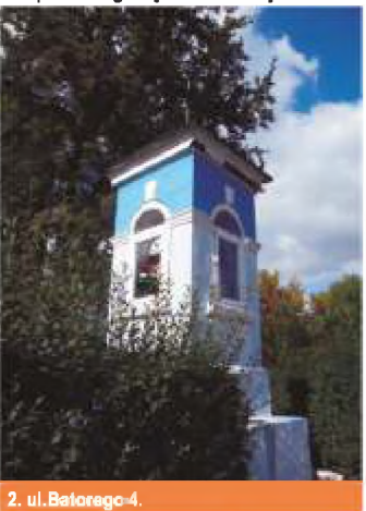
2. ul. Batorego 4.

4 ul. Krakowskie Przedmieście 31. – kapliczka słupowa przy kościółku Nawiedzenia Najświętszej Marii Panny (fundacja Jana Kmity z Wiśnicza z 1373 roku, zatwierdzona w 1392 roku przez królową Jadwigę). Współczesna forma – pochodząca z XVIII – po wielokrotnych przebudowach przedstawia postać Matki Boskiej Anielskiej.