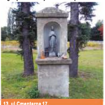
13. ul. Cmentarna 17.