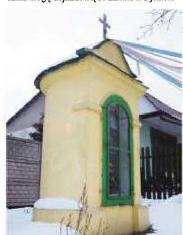
19. ul. Belzacka 183. (róg ul. Dworskiej)

Boskiej Niepokalanie Poczętej. Od wschodu, we wnętrzu, w centralnej części słupa obrazek Św. Agnieszki Panny Męczennicy. Według niektórych źródeł obrazek ten, to podobizna Św. Jadwigi Królowej Polski. Kapliczka wybudowana w XVIII wieku przez rodzinę Wężyków, a w połowie XIX wieku przebudowana przez Jeziorańskich. Wytyczała drogę dojazdową do zamku w Bykach.