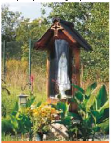
16. ul. Jerozolimska 76/78.