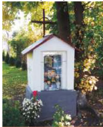
3. ul. Reymonta 7.

Pierwotnie kapliczka miała o jedną kondygnację więcej i znajdowała się w miejscu przebiegu południowej jezdni al. Mikołaja Kopernika. Kapliczkę przeniesiono do obecnej lokalizacji w roku 1979.