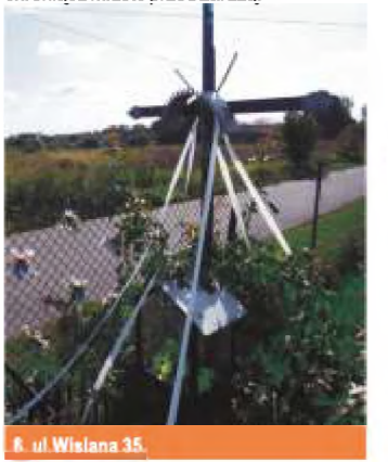
8. ul. Wiślana 35.

7 ul. Zalesicka 35. (róg ul. Grabskiej) – kapliczka słupowa o wysokości ok. 6 m. z podstawą i okrągłym korpusem, ozdobionym kwadratowym gzymsem. Na kolumnie umieszczona jest kwadratowa nadbudowa wysokości 1 m. z blendami, ozdobnym okapem i daszkiem z dachówki zwieńczonym krzyżem. Według przekazów kapliczka ta od XIII do XIX wieku, stojąc przy jednym z głównych traktów królewskich, który łączył Piotrków z Krakowem, oznaczała granicę pomiędzy posiadłościami Starostów Piotrkowskich i zakonu OO Norbertanów z Witowa, wielokrotnie przebudowywana (ostatnio w latach 80-tych XIX w.) od początku XIX wieku traktowana jako „choleryczna” to jest chroniąca miasto przed zarazą.