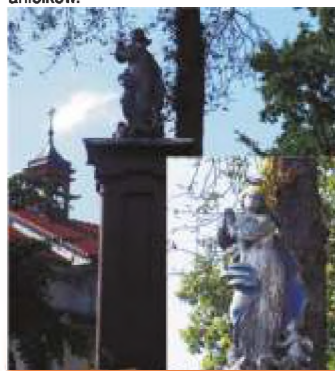
4. ul. Krakowskie Przedmieście 31.

2 ul. Batorego 4. – zabytkowa kapliczka, wokół której – według tradycji – pochowani zostali żołnierze armii Karola Gustawa V, polegali podczas zdobywania Piotrkowa przez Szwedów w kwietniu 1657 roku, oraz w maju tego samego roku, kiedy miasto zostało odbite przez Stefana Czarnieckiego. Dla odstraszenia heretyckich duchów, mieszkańcy Piotrkowa umieścili w kapliczce figurkę Matki Boskiej.