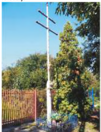
6. ul. Krakowskie Przedmieście 43.

6 ul. Krakowskie Przedmieście 61. – podwójny metalowy krzyż na kamiennej podmurówce, wystawiony w 1873 roku przy trakcie częstochowskim dla odstraszenia zarazy, która panowała w okolicy. Od tego roku do wybuchu II Wojny Światowej było to miejsce pożegnań i powitań pielgrzymek jasnogórskich z Piotrkowa. Obecny wygląd zawdzięcza przeprowadzonej w roku 1982 renowacji.