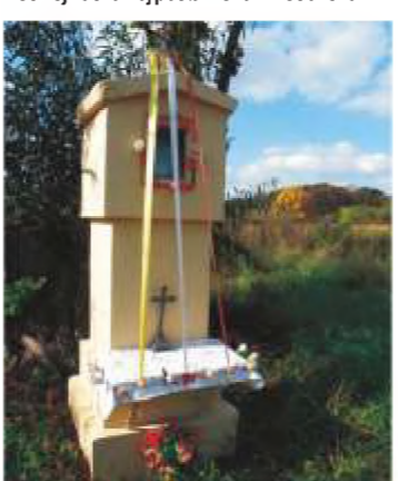
16. ul. Jerozolimska 128.

15 ul. Jerozolimska 76/78. – kapliczka drewniana z porcelanową figurką Matki Boskiej Łaskawej postawiona w 1999 roku.