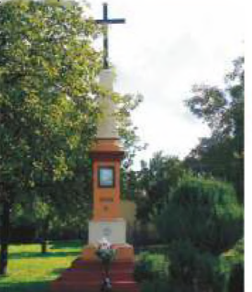
10. ul. Wierzejska 3.

10 ul. Wierzejska 3. – kapliczka w kształcie ostrosłupa z dużym krzyżem w zwieńczeniu, wewnątrz obrazek Wniebowstąpienia Pańskiego. Postawiona w 1900 roku w rozwidieniu dawnego Traktu Wolborskiego (Wolborskie Przedmieście) i Drogi Kolskiej na posesji ul. Wolborska 1 i Wierzejska 2. Odnowiona i przeniesiona w obecne miejsce w roku 1990.