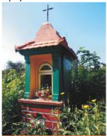
5. ul. Krakowskie Przedmieście 43.

5 ul. Krakowskie Przedmieście 43. – kapliczka murowana z obrazkiem Matki Boskiej Częstochowskiej. Kapliczkę wybudowano w 1939 roku w miejscu, gdzie we wrześniu tego roku pochowano kilku ostatnich obrońców Piotrkowa. Ciało poległych ekshumowano w listopadzie 1939 roku i przeniesiono na cmentarz wojenny.