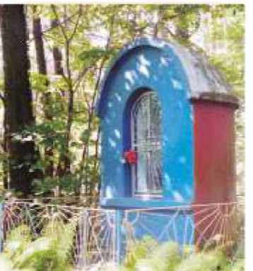
11. ul. Wolborska (w lesie wolborskim)

11 ul. Wolborska (w lesie wolborskim) - kapliczka Św. Jana dwukondygnacyjna, murowana w kształcie półwalca z kopułą zwieńczoną krzyżem, z metalowym ogrodzeniem. Wewnątrz obraz Matki Boskiej Częstochowskiej i piterek z wizerunkiem Św. Jana Chrzciciela. Postawiona przy źródle, w którym według ludowej tradycji w XVIII i XIX wieku pielgrzymi obmywali nogi.