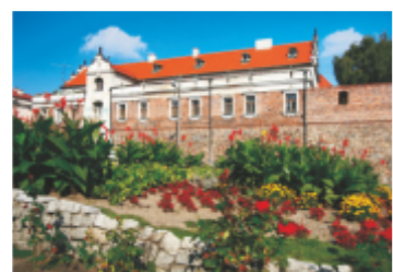
23. Zespół klasztoru ss. Dominikanek

23 ZESPÓŁ DAWNEGO KLASZTORU SS. DOMINIKANEK. Barokowy kościół pw. Matki Boskiej Śnieżnej budowany po 1627 r. z fundacji Katarzyny Warszawskiej. W XVIII wieku klasztor przybudowany do XV-wiecznych murów miejskich. Po roku 1882 przebudowany wg projektu Feliksa Nowickiego. Obok fragment murów miejskich budowanych w II poł. XIV i pocz. XV wieku.