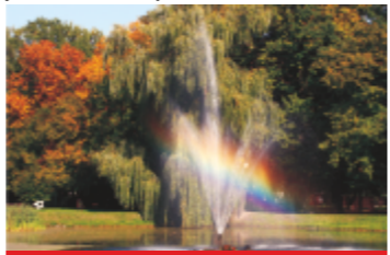
31. Park Miejski im. Ks. J. Poniatowskiego

31 PARK MIEJSKI IM. KS JÓZEFA PONIATOWSKIEGO. Założony w roku 1916 według projektu Józefa Skrobanka. W roku 1927 powiększony o ogród botaniczny. Posiada cechy włoskich i francuskich ogrodów geometrycznych. Podzielony na tzw. "gabinety roślinne". Występuje tu ponad 40 gatunków drzew i krzewów, w tym rzadkie okazy drzew korkowego i ciemiowego oraz krzewy magnolii. W części centralnej staw z wodotryskiem. Na terenie parku zlokalizowany jest kort tenisowy i ogródek jordanowski, a w sezonie jesienno-zimowym sztuczne lodowisko.