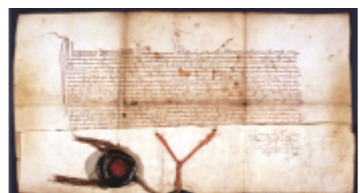
Akt ponowienia prawa miejskiego Piotrkowa wydany 8 czerwca 1404 r. przez króla Władysława Jagiełłę - najstarszy z zachowanych przywilejów miasta.

PIOTRKÓW TRYBUNALSKI Miasto królewskie, w którym od XIII wieku odbywały się zjazdy rycerstwa, zjazdy generalne szlachty polskiej, synody duchownych, obrady sejmowe i sesje Trybunału Koronnego, pierwsze w Europie Najwyższego Sądu dawnej Rzeczypospolitej (1578-1793). Tu rozpoczęli swoje rządy, obierani władcami na sejmach elekcyjnych potomkowie Władysława Jagiełły, który w 1404 r. potwierdził wszystkie dawne przywileje Piotrkowa i zapewnił miastu królewską opiekę.