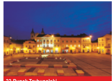
22. Rynek Trybunalski

21 KOŚCIÓŁ EWANGELICKO-AUGSBURSKI (barok). Pierwotnie kościół klasztoru oo. Pijarów. Budowany w latach 1689-1718, opuszczony po pożarze we wrześniu 1786 r. Zakupiony przez władze pruskie w roku 1793 i przeznaczony dla powstającej wtedy parafii protestanckiej.