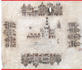
Rynek przed pożarem miasta w 1786 r. anonimowy rysunek ok. 1800 r. (w zbiorach Biblioteki Jagiellońskiej)