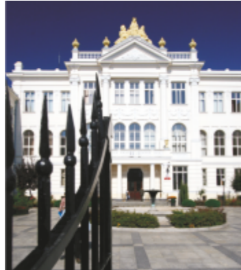
25. Budynek sądu

25 BUDYNEK SĄDU (neoklasycyzm) budowany w latach 1905-1909 według projektu Feliksa Nowickiego. Od roku 1975 do 1978 siedziba Urzędu Wojewódzkiego.