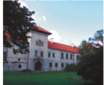
30. Zamek Jaxów-Bykowskich

30 ZAMEK JAXÓW-BYKOWSKICH W BYKACH. Wzniesiony w XV lub XVI wieku zamek obronny, przebudowany ok. 1604 r. na pałac. Odrestaurowany po II wojnie światowej. Obecnie siedziba Ośrodka Doradztwa Rolniczego. Przylegający do zamku park jest miejscem dorocznych wystaw rolniczych.