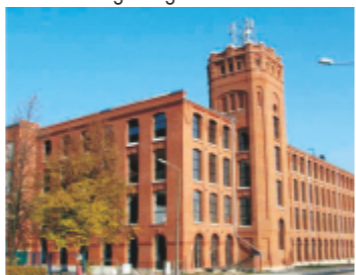
32. Manufaktura Piotrkowska

32 MANUFAKTURA PIOTRKOWSKA. Budowana od roku 1893. Uruchomiona w styczniu 1896 r. przez spółkę: Frumkin, Schlosberg, Wyszezańsk, która wybudowała również osiedle przemysłu włókienniczego na Bugaju. W roku 1911 wykupiona przez łódzką spółkę "Poznański, Silberstein i Ska", która dobudowuje istniejący do dzisiaj, czterokondygnacyjny budynek przędzalni wełny. W okresie II wojny światowej Niemcy organizują tu produkcję części samolotowych oraz warsztaty stolarskie, produkujące baraki drewniane dla potrzeb wojska. Po wojnie Manufaktura zostaje przekształcona w Zakłady Przemysłu Bawełnianego "Sigmatex".