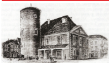
Ratusz miejski - do roku 1792 siedziba Trybunału Koronnego

PIOTRKÓW TRYBUNALSKI Miasto królewskie, w którym od XIII wieku odbywały się zjazdy rycerstwa, zjazdy generalne szlachty polskiej, synody duchownych, obrady sejmowe i sesje Trybunału Koronnego, pierwsze w Europie Najwyższego Sądu dawnej Rzeczypospolitej (1578-1793). Tu rozpoczęli swoje rządy, obierani władcami na sejmach elekcyjnych potomkowie Władysława Jagiełły, który w 1404 r. potwierdził wszystkie dawne przywileje Piotrkowa i zapewnił miastu królewską opiekę.