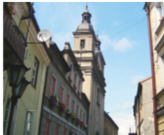
21. Kościół ewangelicko-augsburski

19 KOŚCIÓŁ PW. ŚW. JACKA I ŚW. DOROTY , (gotycki, barokizowany) budowany w I poł. XV wieku. Dawniej kościół klasztorny oo. Dominikanów (likwidacja w 1864 r.). Według tradycji klasztor fundowany przez Kazimierza Wielkiego. Od roku 1922 drugi po Farze kościół parafialny w Piotrkowie.