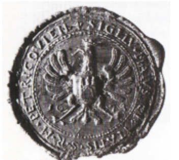
Odcisk pieczęci większej miasta Piotrkowa z roku 1674 (zbiory Muzeum)

Piotrków Trybunalski , liczący 79 tys. mieszkańców, położony jest w centrum Polski na skrzyżowaniu ważnych szlaków komunikacyjnych w odległości 140 km od Warszawy, 150 km od Katowic, 100 km od Kielc i 45 km od Łodzi, przy linii kolei warszawsko-wiedeńskiej. Wyjątkowy klimat nadaje miastu piękna architektura Starówki z wąskimi uliczkami i pozostałościami murów obronnych.