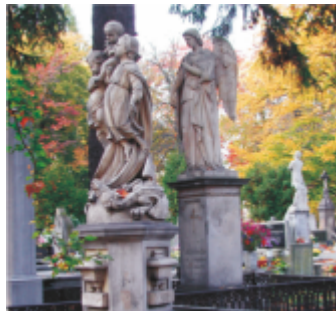
17. Stary cmentarz katolicki