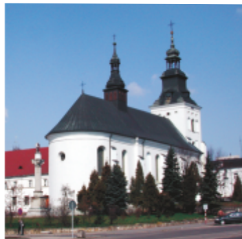
24. Sanktuarium Matki Bożej Piotrkowskiej

24 SANKTUARIUM MATKI BOŻEJ PIOTRKOWSKIEJ. Wczesnobarokowy zespół klasztorny oo. Bernardynów, kościół pw. Matki Bożej Anielskiej. Klasztor ufundowany przez rodzinę Starzewskich, budowany w latach 1640-43.