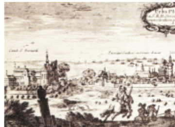
Najstarszy widok Piotrkowa - miedzioryt wg. rys. Eryka Dahlbergha z 1657 r. (Samuel Puffendorf „De rebus Carolo Gustavo Suecie Regis gestis...” 1696 r.)

Piotrków to miasto wielu kultur, w którym podziwiać można wspaniałe zabytki architektury i sztuki sakralnej.