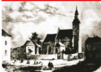
Widok kościoła farnego, rycina Antoniego Tomaszewskiego z 1865 r.