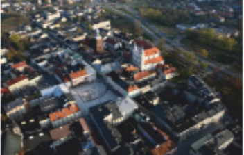
Piotrków Trybunalski - stare miasto

Wśród budowli godnych polecenia znajdują się m.in. kościoły katolickie, cerkiew prawosławna, kościół ewangelicko-augsburski i synagoga.