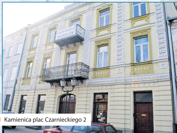
■ Kamienica plac Czarnieckiego 2