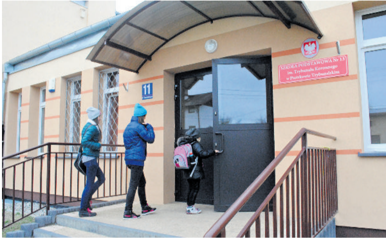
■ W SP13 wymieniono okna i ocieplono ściany

Miasto, oprócz środków własnych inwestowanych w szkoły, pozyskuje także pieniądze z Wojewódzkiego Funduszu Ochrony Środowiska i Gospodarki Wodnej oraz z rządowego programu „Radosna Szkoła”. ■