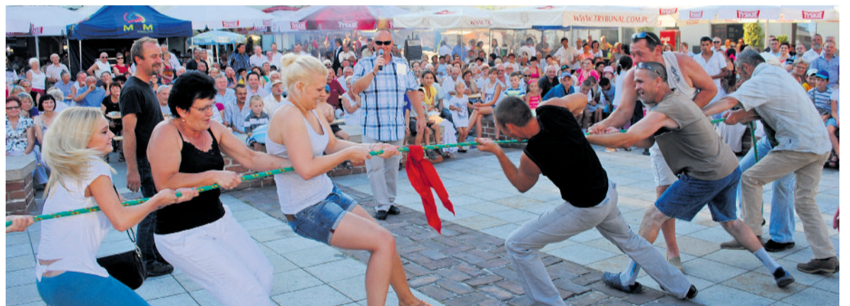
■ Gry i zabawy to stały punkt imprez organizowanych na Rynku