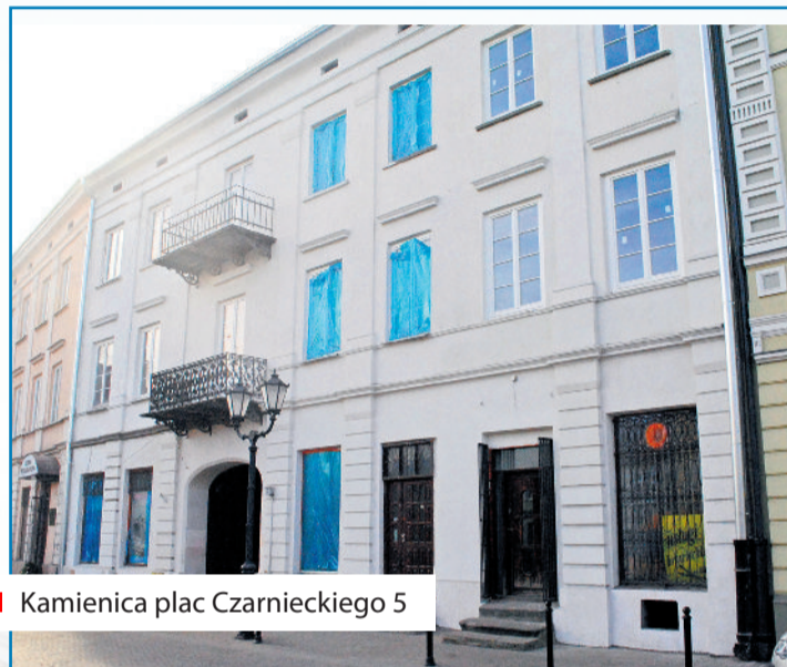
■ Kamienica plac Czarnieckiego 5