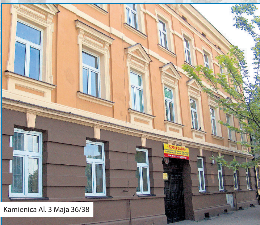
■ Kamienica Al. 3 Maja 36/38