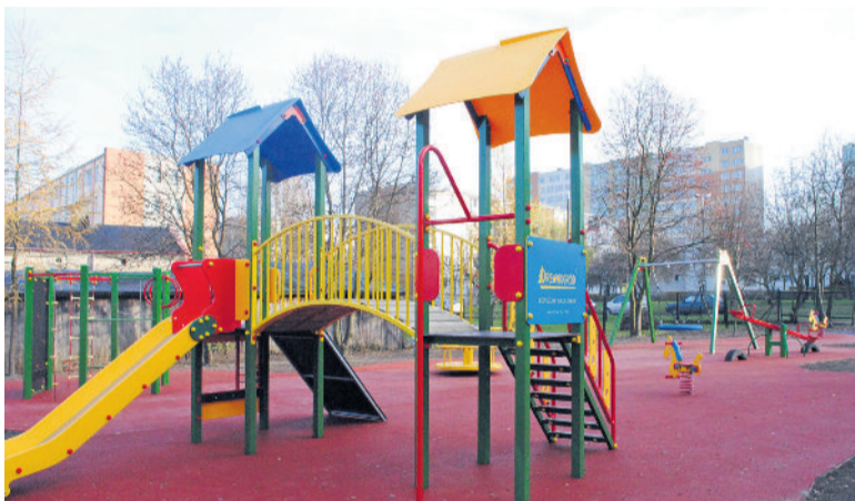
■ Nowy plac zabaw przy ul. Poprzecznej