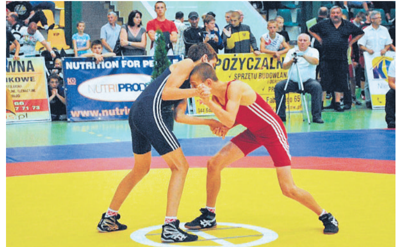
■ Podczas zawodów stoczono wiele emocjonujących walk

Piotrków Trybunalski był jednym z miast, w którym zorganizowano XIX Ogólnopolską Olimpiadę Młodzieży w sportach letnich.