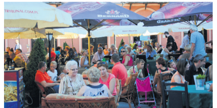
■ Ogródki gastronomiczne wpisały się w wizerunek Starówki