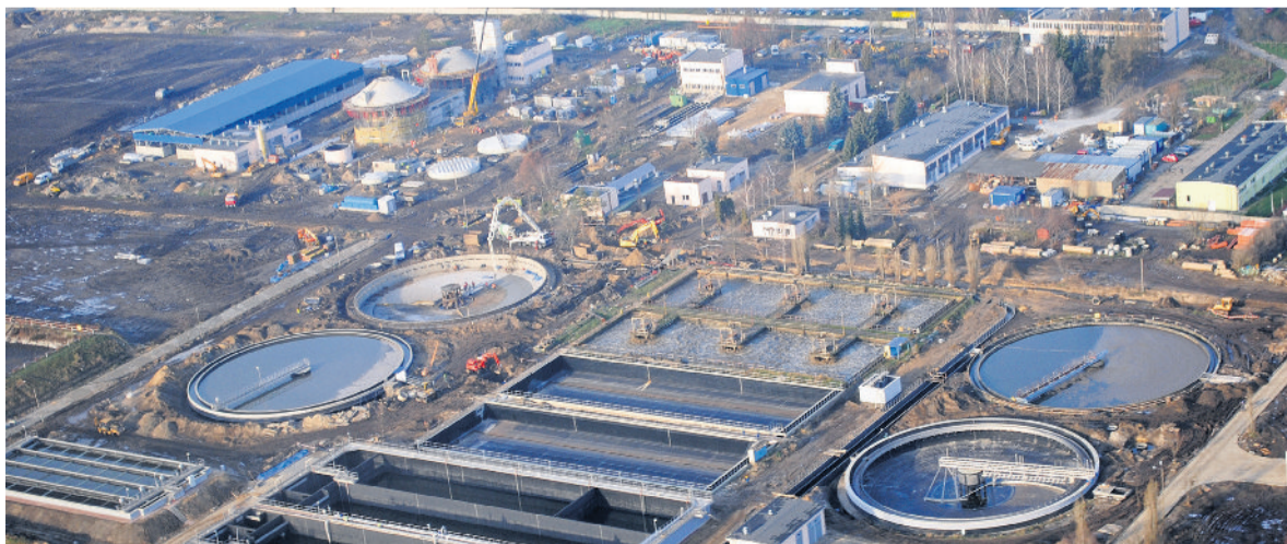
■ Ogrom inwestycji prowadzonej przy ul. Podole widać dopiero z „lotu ptaka”

fosforu w ściekach – zaznacza wiceprezydent i dodaje, że odbiłoby się to na ich cenie, która mogłaby wówczas wynieść nawet 60 zł za metr sześcienny. - Myśląc o budżetach domowych piotrkowian, aby wydatki były niższe, konieczne było podjęcie się tego zadania – podsumowuje wiceprezydent. ■