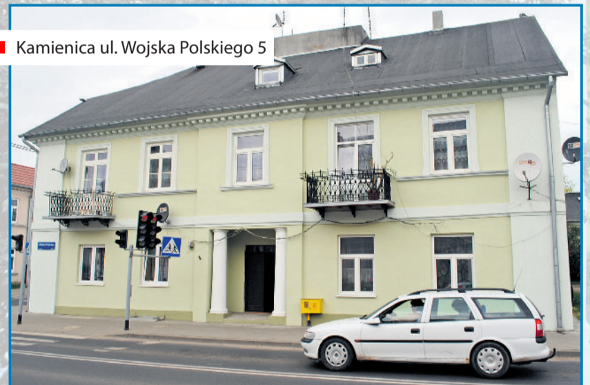
■ Kamienica ul. Wojska Polskiego 5