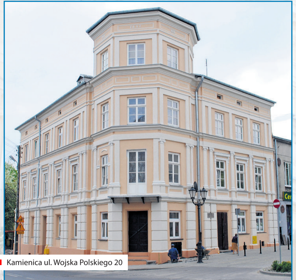
■ Kamienica ul. Wojska Polskiego 20