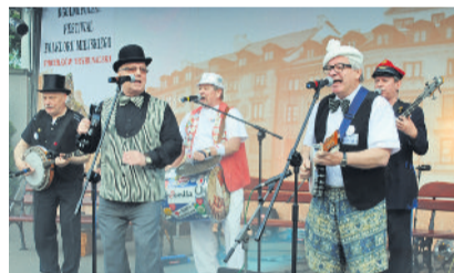
■ Występy kapel podwórkowych