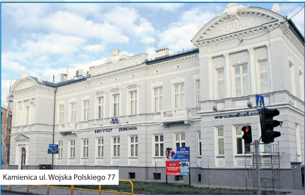
Kamienica ul. Wojska Polskiego 77