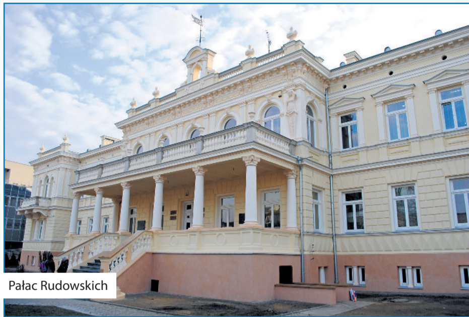
■ Pałac Rudowskich