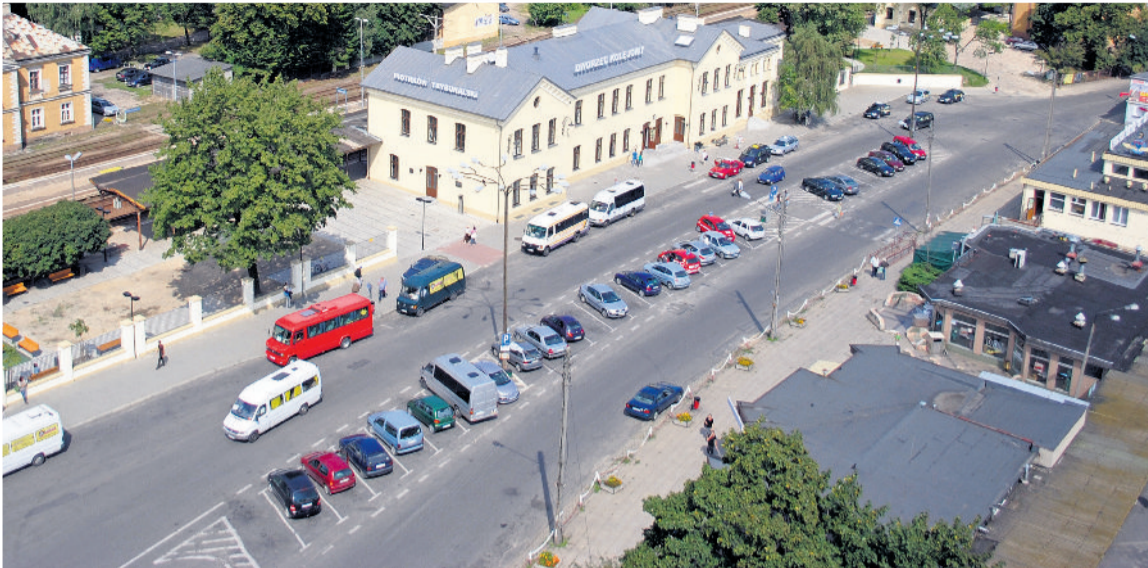
■ Na POW całkowicie zmieni się układ drogowy

■ Trakt Wielu Kultur pozwolił odmienić oblicze centrum miasta. Obecnie jesteśmy w trakcie realizacji drugiego etapu projektu.