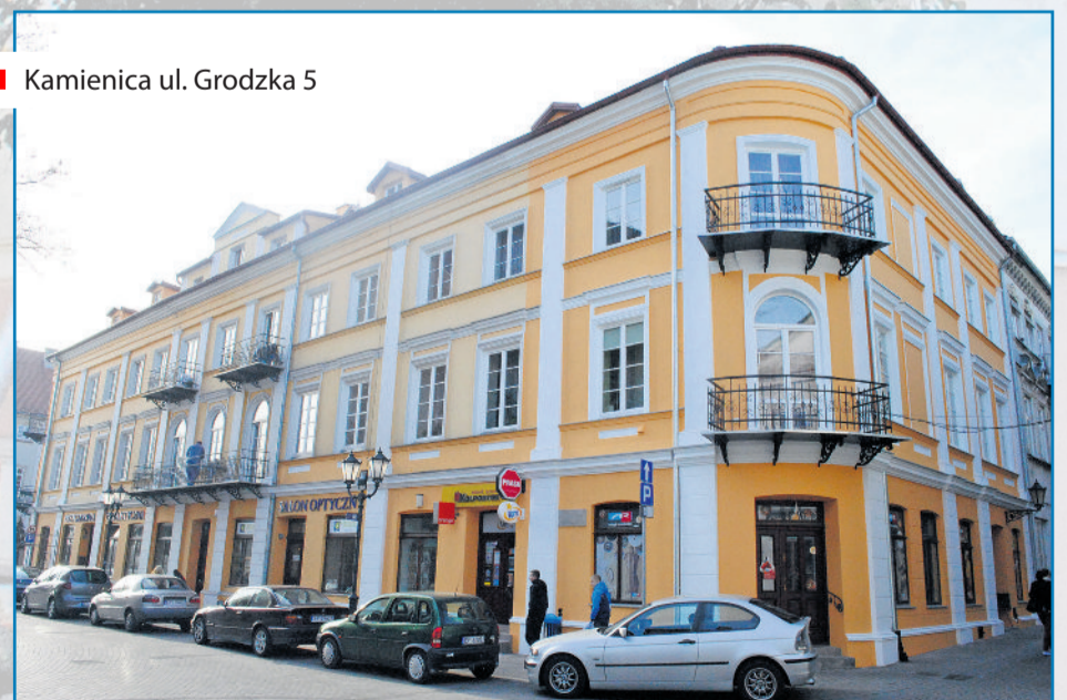
■ Kamienica ul. Grodzka 5