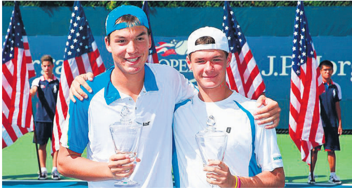
■ Kamil Majchrzak (z prawej), jako pierwszy Polak w historii, zwyciężył w wielkoszlemowym US Open