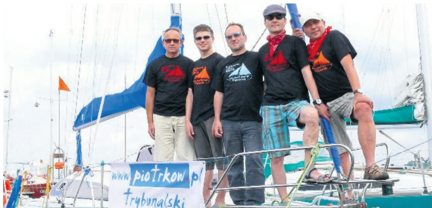
■ : Załoga jachtu „Piotrcovia”