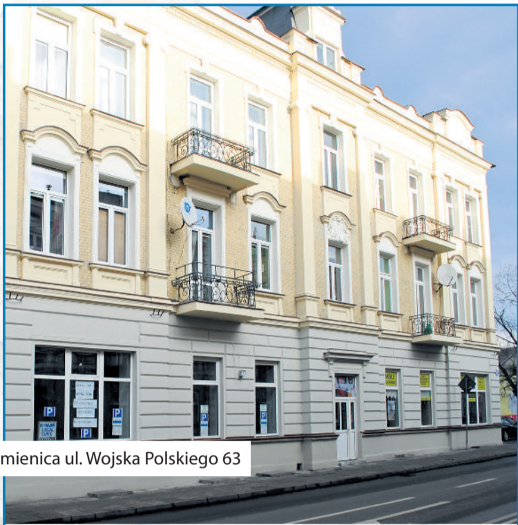
■ Kamienica ul. Wojska Polskiego 63