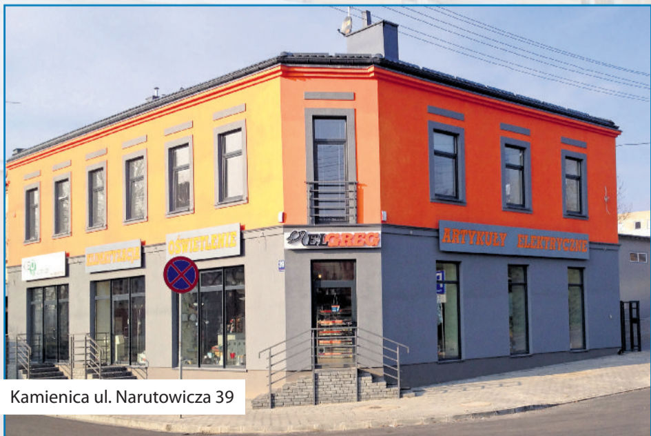
■ Kamienica ul. Narutowicza 39