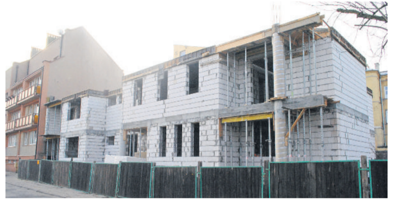
■ Blok komunalny powstaje przy ulicy Zamurowej

■ 76 rodzin znajdzie mieszkania w nowych blokach Towarzystwa Budownictwa Społecznego. Pierwszy powstaje przy ulicy Zamurowej, a kolejne dwa staną przy ulicy Wojska Polskiego.