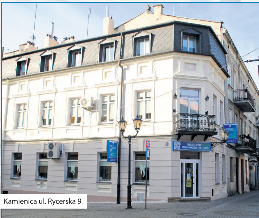
■ Kamienica ul. Rycerska 9

Systematyczna praca zapoczątkowana realizacją projektu Trakt Wielu Kultur spowodowała, że piotrkowskie Stare Miasto odzyskało swój urok. Równolegle rozpoczęto remonty miejskich kamienic. W ślad za działaniami miasta ruszyli właściciele prywatnych nieruchomości. Kamienicznicy modernizując swoje budynki poprawiają wizerunek miasta. Nie wszyscy wiedzą, że taką inwestycję mogą zgłaszać do konkursu „Nowa elewacja”, w którym łącznie pula nagród stanowi 75 tys. zł. Organizowany, z inicjatywy prezydenta Krzysztofa Chojniaka, plebiscyt na najładniej odnowioną kamienicę cieszy się popularnością. ■