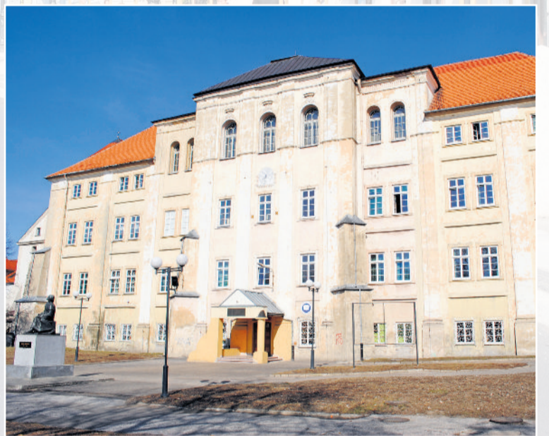
■ I LO czeka kompleksowa modernizacja