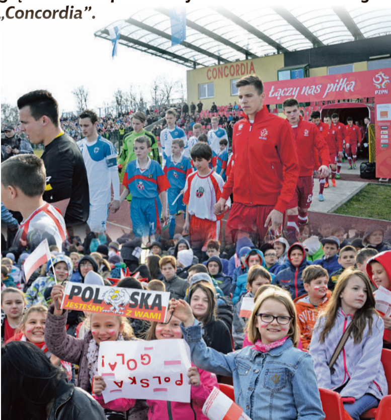
■ Mecz reprezentacji przyciągnął wielu kibiców