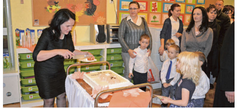
■ Dzieci wraz z rodzicami świętowali zakończenie prac w PS 24

a niebawem do tego grona dołączy Przedszkole Samorządowe nr 5 oraz przedszkole nr 26. – W tej ostatniej placówce prowadzimy rozbudowę, dzięki czemu więcej dzieci będzie mogło uczęszczać do przedszkola.