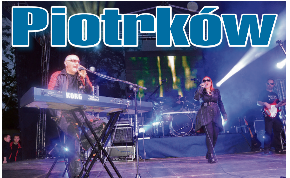
■ Gwiazdą tegorocznych Imienin Piotrków był zespół Lombard