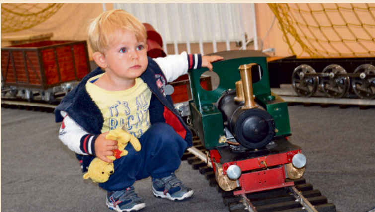
■ ...jak i młodszych sympatyków kolejek

Przez dwa dni piotrkowianie mieli okazję podziwiać najpiękniejsze, najbardziej okazałe i najbardziej cenione makiety i modele kolejowe. Do naszego miasta zjechali pasjonaci kolejek nie tylko z Polski, ale także z Czech, Holandii, Austrii i Niemiec. Organizatorzy zapowiadają kolejne edycje trybunałów.