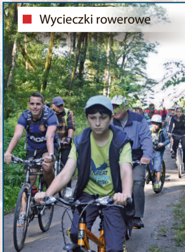
■ Wycieczki rowerowe