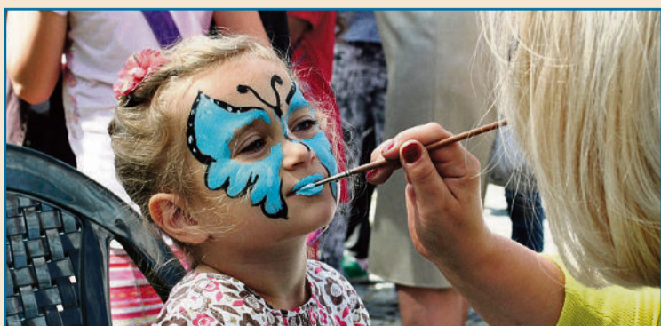
■ Zabawa podczas rodzinnego festynu plenerowego