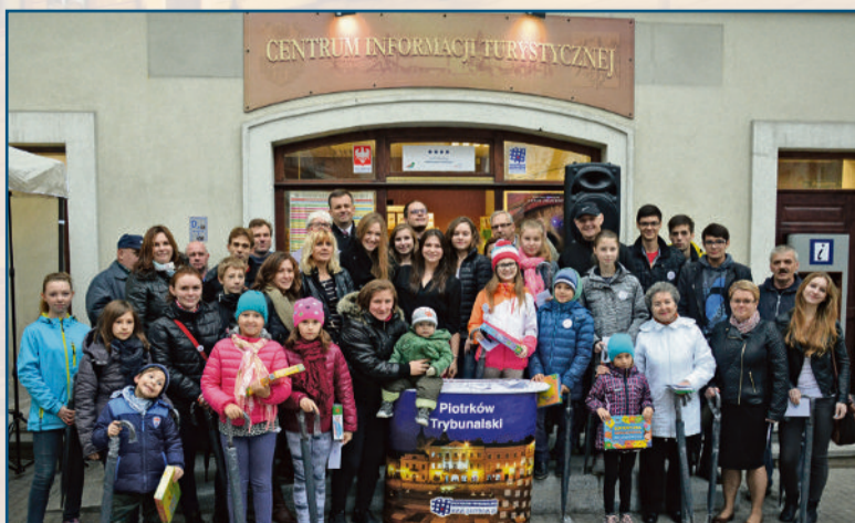
■ Gry miejskie cieszą się dużą popularnością

Piotrkowski CIT to także największa skarbnica pamiątek z Piotrkowa Trybunalskiego. Można tutaj zakupić nie tylko publikacje książkowe, ale także m.in. magnesy, pocztówki, ceramiczne lampy przedstawiające miniatury Zamku Królewskiego i Wieży Ciśnień. ■