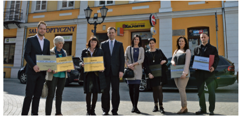
■ Laureaci „Nowej Elewacji 2013” na tle zwycięskiej kamienicy