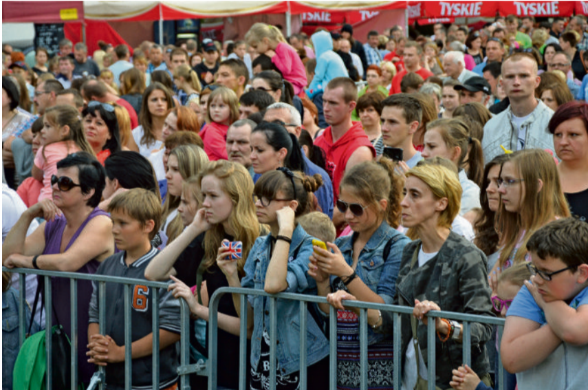
■ Piotrkowianie tłumnie biorą udział w święcie miasta

■ Ostatni weekend czerwca to święto wszystkich mieszkańców Piotrkowa Trybunalskiego. Wówczas obchodzimy Imieniny Piotrków. Jak co roku, również podczas tegorocznego święta miasta bawiło się tysiące piotrkowian. W bogatej ofercie każdy znalazł coś dla siebie. Był tradycyjny Jarmark Trybunalski, występy zespołów z miast partnerskich, koncerty w Rynku Trybunalskim, zawody sportowe oraz samochodowe. Dni Miasta uświetniły koncerty UK Legends oraz Lombard, ale nie zabrakło również występów piotrkowskich artystów. ■