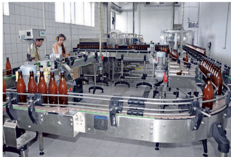
■ Produkcja piotrkowskiego piwa „Jan Olbracht”

■ W naszym mieście powstanie pierwszy w Polsce „browar do góry nogami”, a produkowana w Piotrkowie mieszanka ziaren wygrała ministerialny konkurs „Doceń polskie” – to tylko część z wielu przykładów nowatorskich pomysłów, które pozwalają odnosić sukcesy piotrkowskim firmom.