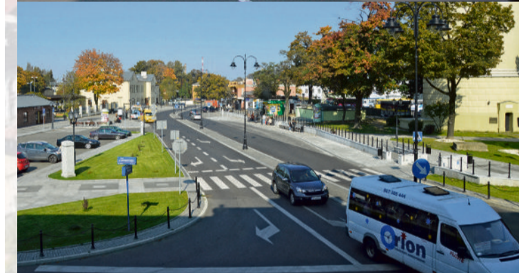
■ Po modernizacji całkowicie zmienił się wygląd i układ ulicy POW