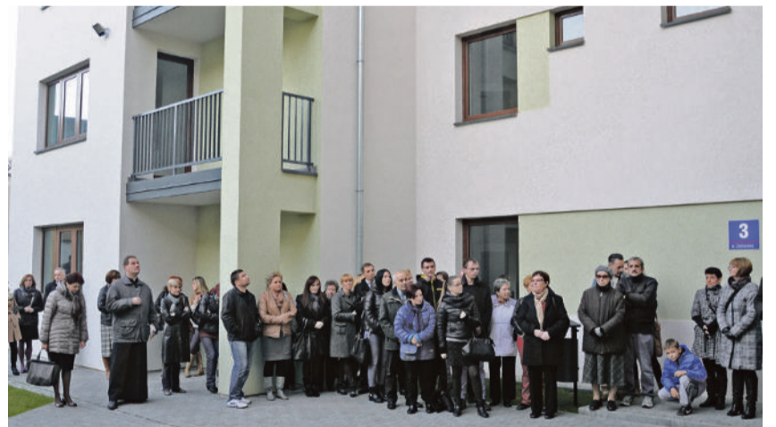
■ Lokatorzy do bloku przy Zamkowej wprowadzili się w październiku

Piotrkowianie mogą liczyć także na mieszkania w innych częściach miasta. W 2015 roku aż sześćdziesiąt rodzin zamieszka przy ulicy Wojska Polskiego 133, a miasto przygotowuje już tereny pod bloki przy ulicy Broniewskiego. ■