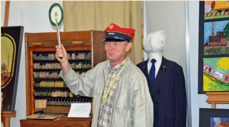
■ Trybunały przyciągnęły zarówno starszych...

■ ...może niedokładnie pociągi, a ich modele, które z całej Europy zjechały do naszego miasta na Trybunały Modelarstwa Kolejowego.