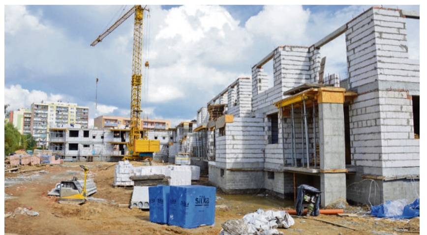
■ Przy ulicy Wojska Polskiego powstają bloki dla 60 rodzin