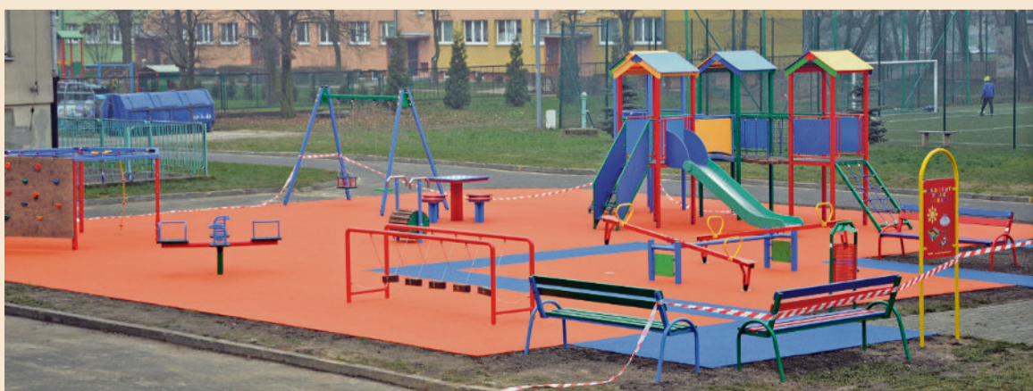
■ Nowoczesny plac zabaw przy Zespole Szkolno-Gimnazjalnym nr 1

Tegoroczne inwestycje zakończyły się pod koniec listopada. Dzieci nie dość, że bawią się na rozmaitych zabawkach to są przy tym bardzo bezpieczne. Podłoże każdego placu pokryte jest gumową nawierzchnią, która chroni dzieci przed skutkami ewentualnych upadków.