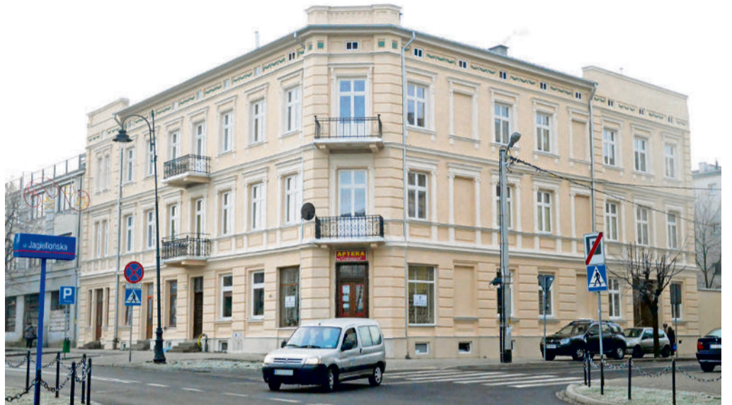
■ ...a tak prezentuje się dzisiaj