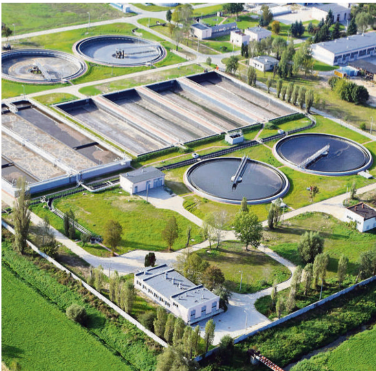
■ Oczyszczalnia ścieków z „lotu ptaka”

Przebudowana oczyszczalnia działa już na pełnych obrotach. Badania udowadniają, że wszystkie normy są spełniane, a osiągnięte wartości są zdecydowanie niższe od nakładanych przez prawo. ■