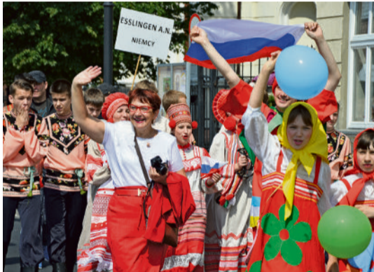
■ Nowością obchodów była parada zespołów ludowych z miast partnerskich