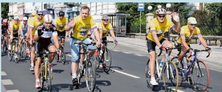
■ Ostatni trening kolarzy przed startem w wyścigu

■ Kilkunastu piotrkowskich sympatyków kolarstwa wzięło udział w Tour de Pologne Amatorów.