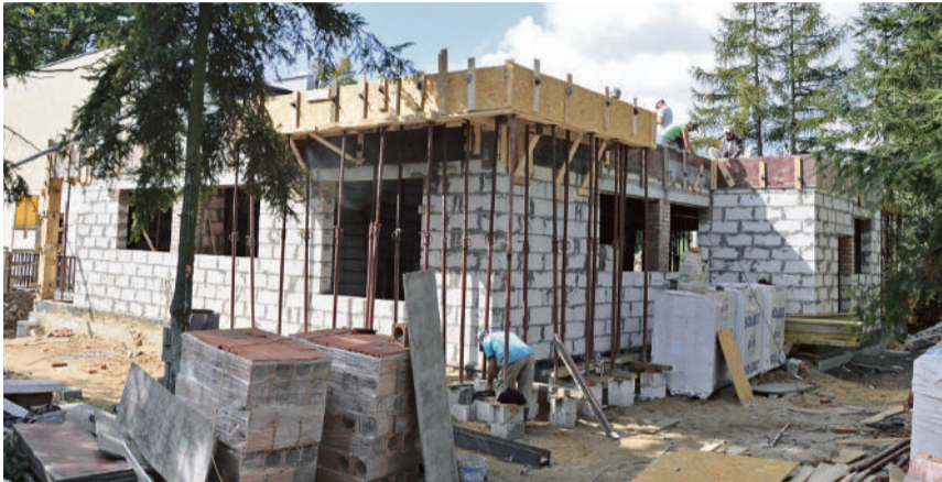
■ Rozbudowa przedszkola nr 26 trwa od czerwca 2014