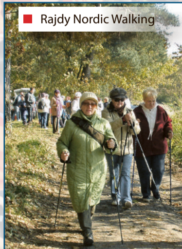
■ Rajdy Nordic Walking