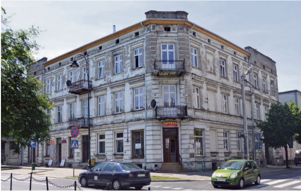
■ Tak wyglądała kamienica przy al. 3 Maja 23 przed remontem...

Oblicze zmieniają także prywatne kamienice, a właściciele tych budynków biorą udział w konkursie „Nowa Elewacja”. W ciągu sześciu edycji tego konkursu wyróżniono i nagrodzono kilkunastu właścicieli kamienic. Do końca lutego przyszłego roku można zgłaszać wyremontowane budynki do kolejnej edycji plebiscytu. ■