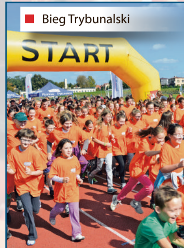
■ Bieg Trybunalski