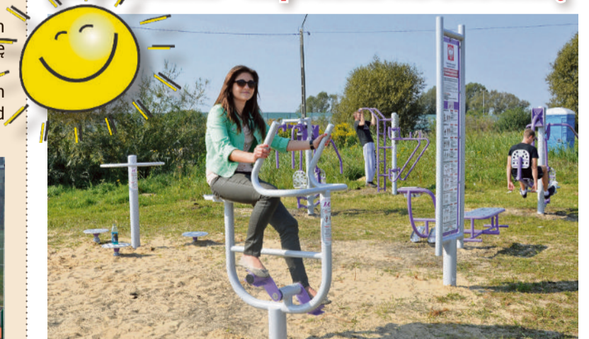
■ Siłownia plenerowa cieszy się dużą popularnością

Piotrków Trybunalski ma pierwszą bezpłatną siłownię, na której ćwiczyć można wszystkie partie mięśni. Do dyspozycji piotrkowian są drążek do podciągania, ławeczka do wyciskania, orbitrek oraz rowerek. Wszystko to znajduje się na kąpielisku „Słoneczko”, więc z urządzeń można korzystać przez cały rok.