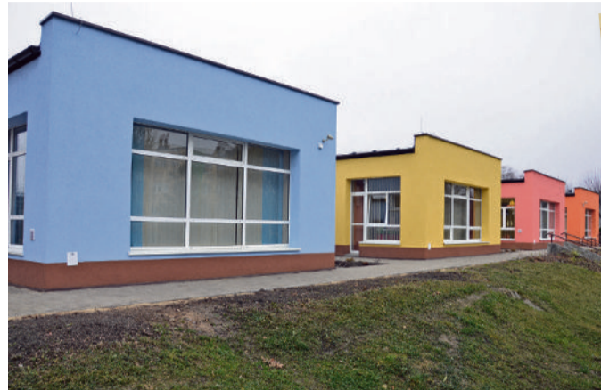
■ Przedszkole 24 po remoncie prezentuje się bardzo kolorowo