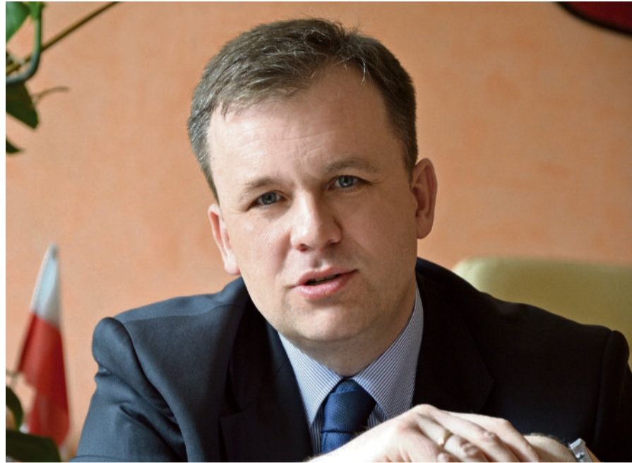
Prezydent Piotrkowa Trybunalskiego Krzysztof Chojniak

że realizacja unijnych projektów jest możliwa tylko dzięki zapewnieniu odpowiedniego wkładu własnego. Często są to niemałe pieniądze. Dlatego kluczowe jest, aby budżet miasta był stabilny i bezpieczny. Musimy systematycznie dbać o poziom dochodów. Dzięki temu miasto może się dalej rozwijać i pozyskiwać wielomilionowe dotacje na realizację ważnych dla mieszkańców miasta inwestycji.