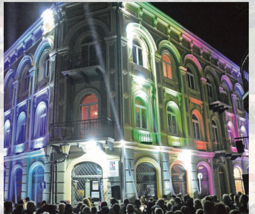
■ Walory architektoniczne ODA podkreślił efektowny pokaz świetlny

Duży wpływ na te zmiany ma realizacja projektu Trakt Wielu Kultur, którego drugi etap zakończyliśmy w tym roku. W tej odsłonie zupełnie nowy blask zyskały budynki Ośrodka Działań Artystycznych, I Liceum Ogólnokształcącego oraz Zamku Królewskiego. Ulica Starowarszawska swoim wyglądem idealnie wpasowuje się już w klimat Starówki, a zmodernizowana ulica POW stała się wizytówką Piotrkowa Trybunalskiego.