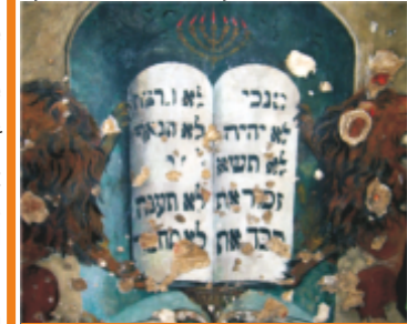
Fresk na ścianie Synagogi