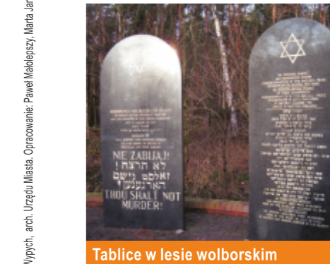
Tablice w lesie wolborskim