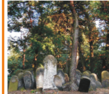
Macewy na cmentarzu żydowskim

MACEWA nagrobkowa płyta kamienna z inskrypcjami, półkolistie zwieńczona, niegdyś malowana; umieszczona pionowo w nogach zmarłego, zwrócona ku wschodowi.