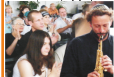
Koncert zespołu Jarmuła Band

KLEZMER muzykant weselnokarczmiany lub grający na przyjęciach. Tradycję muzykowania przekazywano z pokolenia na pokolenie; tak powstawały dynastie klezmerskie. Także: święte instrumenty.