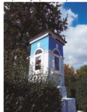
2. ul.Batorego 4.

2 ul.Batorego 4. – zabytkowa kapliczka, wokół której - według tradycji - pochowani zostali żołnierze armii Karola Gustawa V, polegali podczas zdobywania Piotrkowa przez Szwedów w kwietniu 1657 roku, oraz w maju tego samego roku, kiedy miasto zostało odbite przez Stefana Czarnieckiego. Dla odstraszenia heretyckich duchów, mieszkańcy Piotrkowa umieścili w kapliczce figurkę Matki Boskiej.