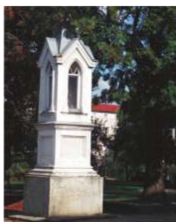
12. ul.Wojska Polskiego 41/43.

11 ul.Wolborska (w lesie wolborskim) – kapliczka Św. Jana dwukondygnacyjna, murowana w kształcie półwalca z kopułą zwieńczoną krzyżem, z metalowym ogrodzeniem. Wewnątrz obraz Matki Boskiej Częstochowskiej i piterek z wizerunkiem Św. Jana Chrzciciela. Postawiona przy źródle, w którym według ludowej tradycji w XVIII i XIX wieku pielgrzymi obmywali nogi.