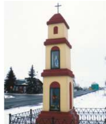
17. ul.Gała 2. (róg ul.Łódzkiej)