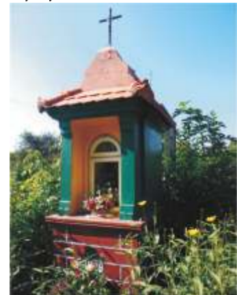
5. ul.Krakowskie Przedmieście 43.

5 ul.Krakowskie Przedmieście 43. – kapliczka murowana z obrazkiem Matki Boskiej Częstochowskiej. Kapliczka wybudowana w 1939 roku w miejscu, gdzie we wrześniu tego roku pochowano kilku ostatnich obrońców Piotrkowa. Ciała poległych ekshumowano w listopadzie 1939 roku i przeniesiono na cmentarz wojenny.