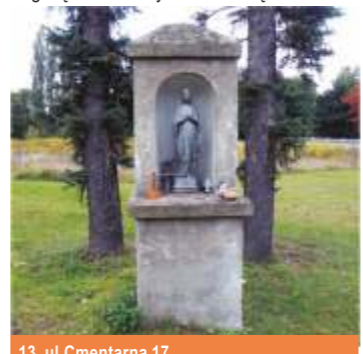
13. ul.Cmentarna 17.