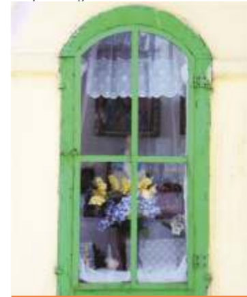
19. ul.Belzacka 183. (róg ul.Dworskiej)