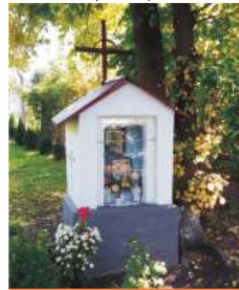
3. ul.Reymonta 7.

Pierwotnie kapliczka miała o jedną kondygnację więcej i znajdowała się w miejscu przebiegu południowej jezdni al.Mikołaja Kopernika. Kapliczkę przeniesiono do obecnej lokalizacji w roku 1979.