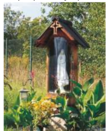
15. ul.Jerozolimka 76/78.