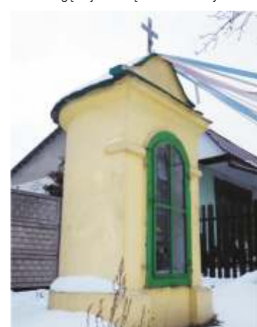
19. ul.Belzacka 183. (róg ul.Dworskiej)

Boskiej Niepokalanego Poczęcia. Od wschodu, we wnęce, w centralnej części słupa obrazek Św. Agnieszki Panny Męczennicy. Według niektórych źródeł obrazek ten, to podobizna Św. Jadwigi Królowej Polski. Kapliczka wybudowana w XVIII wieku przez rodzinę Wężyków, a w połowie XIX wieku przebudowana przez Jeziorańskich. Wytyczała drogę dojazdową do zamku w Bykach.