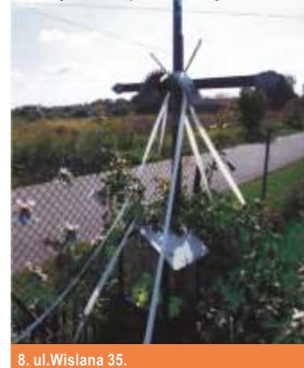
8. ul.Wiślana 35.

7 ul.Zalesicka 35. (róg ul.Grabskiej) – kapliczka słupowa o wysokości ok. 6 m. z podstawą i okrągłym korpusem, ozdobionym kwadratowym gzymsem. Na kolumnie umieszczona jest kwadratowa nadbudowa wysokości 1 m. z blendami, ozdobnym okapem i daszkiem z dachówki zwieńczonym krzyżem. Według przekazów kapliczka ta od XIII do XIX wieku, stojąc przy jednym z głównych traktów królewskich, który łączył Piotrków z Krakowem, oznaczała granicę pomiędzy posiadłościami Starostów Piotrkowskich i zakonu OO Norbertanów z Witowa. Wielokrotnie przebudowywana (ostatnio w latach 80-tych XIX w.) od początku XIX wieku traktowana jako „choleryczna” to jest chroniąca miasto przed zarazą.