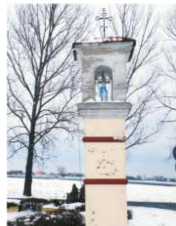
18. ul.Kasztelańska 1. (róg ul.Łódzkiej)

17 ul.Gała 2. (róg ul.Łódzkiej) – kapliczka słupowa, o wysokości ok. 4 m., z kwadratowym cokolem. We wnętrzu od strony południowej w I kondygnacji obraz Matki Boskiej Częstochowskiej i popiersie Jana Pawła II; w II kondygnacji figura Matki Boskiej Niepokalanego Poczęcia. Ostatnia, III kondygnacja zamurowana, z zaznaczonymi farbą blendami. Daszek z dachówki z metalowym krzyżkiem. Postawiona przez właścicieli młyna w Daszówce w początkach XIX wieku.