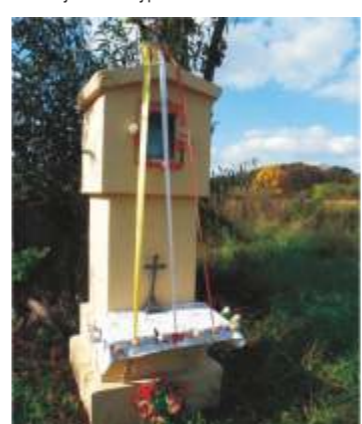
16. ul.Jerozolimka 128.

15 ul.Jerozolimka 76/78. – kapliczka drewniana z porcelanową figurką Matki Boskiej Łaskawej postawiona w 1999 roku.