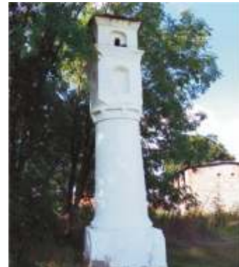
7. ul.Zalesicka 35. (róg ul.Grabskiej)

7 ul.Zalesicka 35. (róg ul.Grabskiej) – kapliczka słupowa o wysokości ok. 6 m. z podstawą i okrągłym korpusem, ozdobionym kwadratowym gzymsem. Na kolumnie umieszczona jest kwadratowa nadbudowa wysokości 1 m. z blendami, ozdobnym okapem i daszkiem z dachówki zwieńczonym krzyżem. Według przekazów kapliczka ta od XIII do XIX wieku, stojąc przy jednym z głównych traktów królewskich, który łączył Piotrków z Krakowem, oznaczała granicę pomiędzy posiadłościami Starostów Piotrkowskich i zakonu OO Norbertanów z Witowa. Wielokrotnie przebudowywana (ostatnio w latach 80-tych XIX w.) od początku XIX wieku traktowana jako „choleryczna” to jest chroniąca miasto przed zarazą.