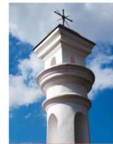
14. ul.Krzywa 14.

Kapliczka – niewielka budowla kultowa, wznoszona przy drogach lub rozdrożach w celach wotywnych, dziękczynnych, obrzędowych itp. W najprostszej postaci drewniana skrzynka z obrazem lub rzeźbą – świętym Jezusa, Matki Bożej lub świętego, zawieszona na drzewie lub słupie. W postaci rozbudowanej niewielka forma architektoniczna drewniana lub murowana. (Wikipedia)