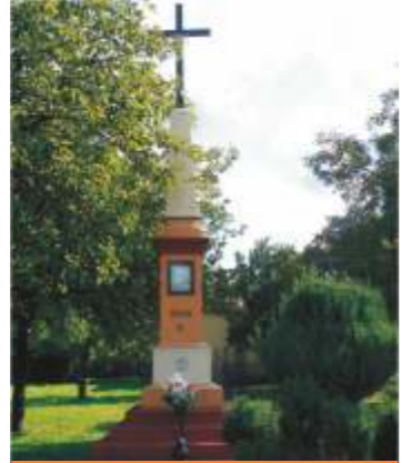
10. ul.Wierzejska 3.

10 ul.Wierzejska 3. – kapliczka w kształcie ostrosłupa z dużym krzyżem w zwieńczeniu, wewnątrz obrazek Wniebowstąpienia Pańskiego. Postawiona w 1900 roku w rozwidleniu dawnego Traktu Wolborskiego (Wolborskie Przedmieście) i Drogi Kolskiej na posesji ul.Wolborska 1 i Wierzejska 2. Odnowiona i przeniesiona w obecne miejsce w roku 1990.