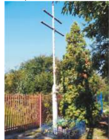
6. ul.Krakowskie Przedmieście 43.

6 ul.Krakowskie Przedmieście 61. – podwójny metalowy krzyż na kamiennej podmurówce, wystawiony w 1873 roku przy trakcie częstochowskim dla odstraszenia zarazy, która panowała w okolicy. Od tego roku do wybuchu II Wojny Światowej było to miejsce pożegnań i powitań pielgrzymek jasnogórskich z Piotrkowa. Obecny wygląd zawdzięcza przeprowadzonej w roku 1982 renowacji.