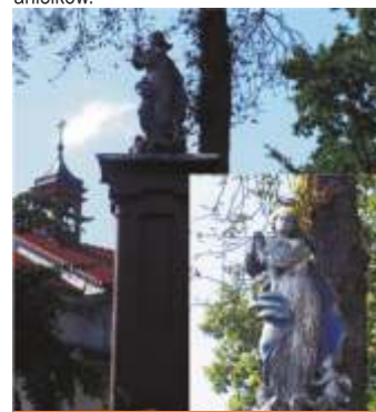
4. ul.Krakowskie Przedmieście 31.

3 ul.Reymonta 7. – kapliczka postawiona w 1860 roku w miejscu zlikwidowanego cmentarza ewangelickiego. Cmentarz ten funkcjonował tu w latach 1702-1860, przy dawnej ulicy Wrocławskie Przedmieście (inna nazwa ulica Kosa). We wnętrzu kapliczki obrazek Matki Boskiej Częstochowskiej oraz figurki aniołków.