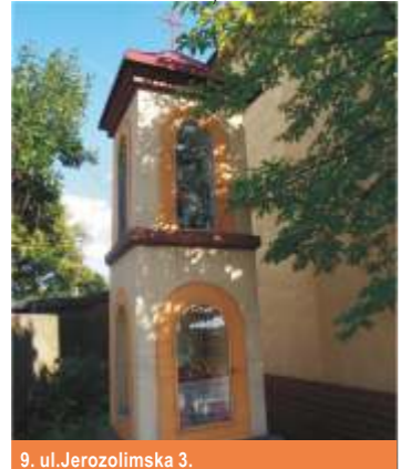
9. ul.Jerozolimka 3.