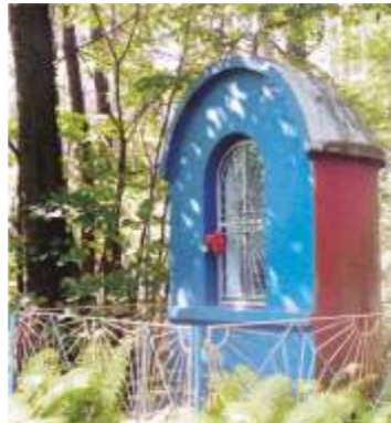
11. ul.Wolborska (w lesie wolborskim)

11 ul.Wolborska (w lesie wolborskim) – kapliczka Św. Jana dwukondygnacyjna, murowana w kształcie półwalca z kopułą zwieńczoną krzyżem, z metalowym ogrodzeniem. Wewnątrz obraz Matki Boskiej Częstochowskiej i piterek z wizerunkiem Św. Jana Chrzciciela. Postawiona przy źródle, w którym według ludowej tradycji w XVIII i XIX wieku pielgrzymi obmywali nogi.