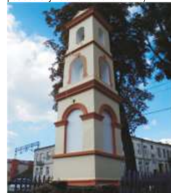
1. ul.Narutowicza 44.

1 ul.Narutowicza 44. – zabytkowa kapliczka, dawniej Św.Mojżesza, obecnie Św.Floriana (obie figurki wewnątrz). Istniejąca współcześnie pochodzi z końca XVIII wieku, wybudowana na miejscu starszej (prawdopodobnie z wieku XVI). Zlokalizowana została przy tak zwanym Trakcie Rokoszyckim, na terenie cmentarza innowierców, którzy zmarli podczas pobytu w Piotrkowie (w tamtych czasach miasto posiadało tylko cmentarze katolickie).